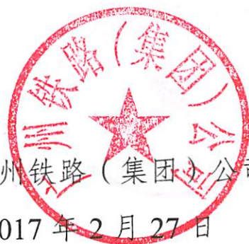
广州铁路(集团)公司