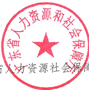
广东省人力资源和社会保障厅