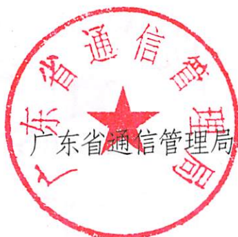
广东省通信管理局