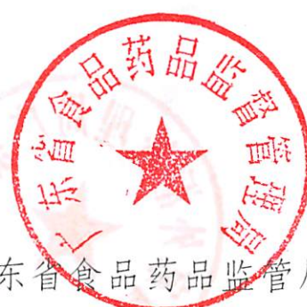
广东省食品药品监督管理局